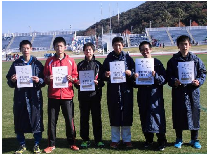
男子区間賞 左側から1区