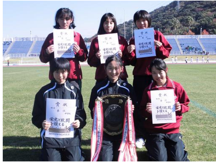
女子優勝 海南第三中学